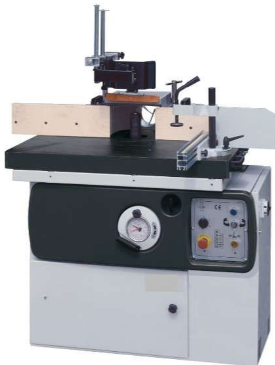
T 250 C