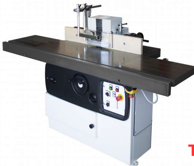
T 250 PL