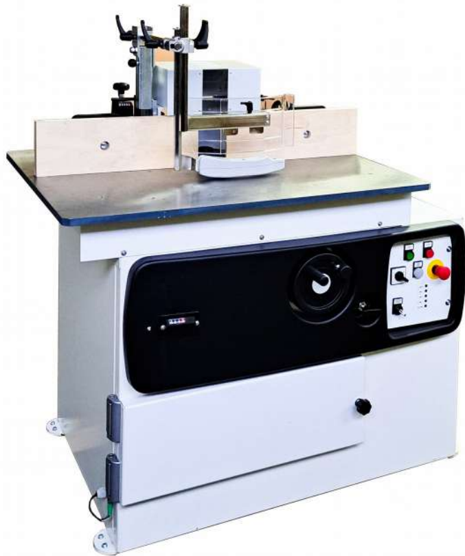
T 250 N